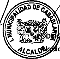
RODRIGO MARTÍNEZ ROCA Alcalde de Casablanca